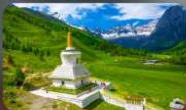
กุเวาสีครุณี