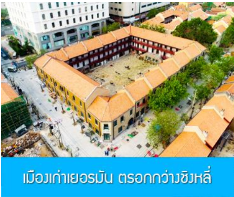
เมืองเก่าเยอรมัน ตรอกกว้างชิงลี่