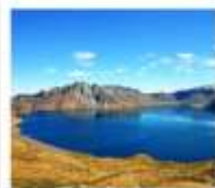
ฉางไป่ซาน