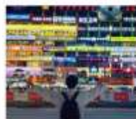
กำแพงมหาวิทยาลัยเหอหนานเป่ย์