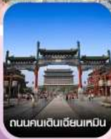
ถนนคนเดินเฉียนเหมิน

✈️ คอนเฟิร์มออกเดินทาง ทุกพีเรียด 2 ท่านขึ้นไป