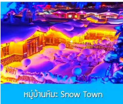
หมู่บ้านหิมะ Snow Town

ท่ามกลางท้องทุ่งและผืนป่าที่ปกคลุมด้วยหิมะราวกับอยู่ในโลกแห่งเทพนิยาย ผ่านหมู่บ้าน เว่ยหูจ้าย 威虎寨 ที่อดีตเคยเป็นที่ตั้งของรังโจรที่มักออกปล้นสะดมชาวบ้าน ม้าลากเลื่อนเป็นยานพาหนะเฉพาะพื้นที่ ๆ ที่นิยมนำมาใช้ในการเดินทางหรือลำเลียงสิ่งของในช่วงฤดูหนาว ที่ใช้ม้ามาลากจูงแคร่เลื่อนให้สามารถเคลื่อนย้ายบนลานหิมะได้