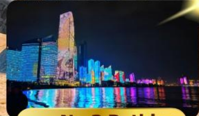
หาด No.3 Bathing

เมนูพิเศษ ชาบูสายพาน 6 วัน 4 คืน เดินทาง : พฤษภาคม 69