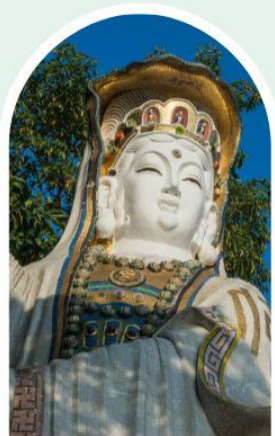
เจ้าแม่กวนอิม ธิพลสภย์