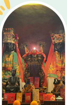
วัดหมิ่นโหมว