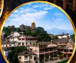
เมืองโบราณเฉิงชิว