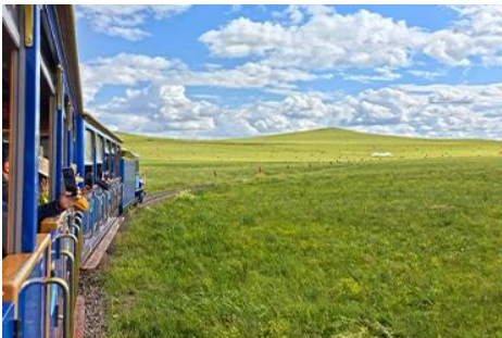
ชมบ้านชาวมองโก

เที่ยง รับประทานอาหารกลางวัน ณ ภัตตาคาร (14)