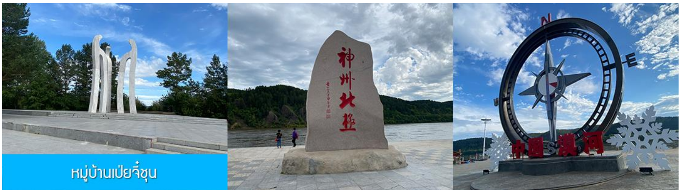
หมู่บ้านเป่ย์จี้ซุน

เที่ยง รับประทานอาหารกลางวัน ณ ร้านอาหารระหว่างทาง (20)