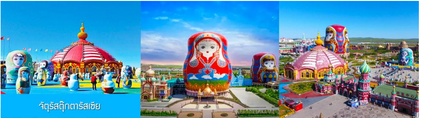
จัตุรัสตุ๊กตารัสเซีย