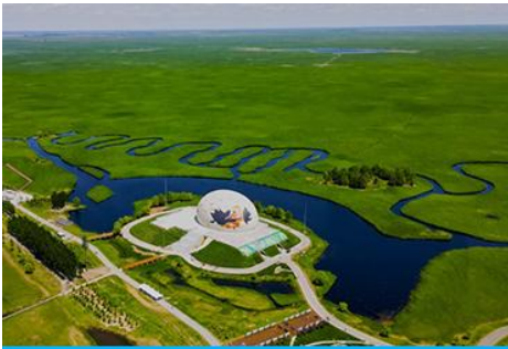
อุทยานชุ่มชื้นจาหลง

เช้า รับประทานอาหารเช้า ณ ห้องอาหารของโรงแรม (7)