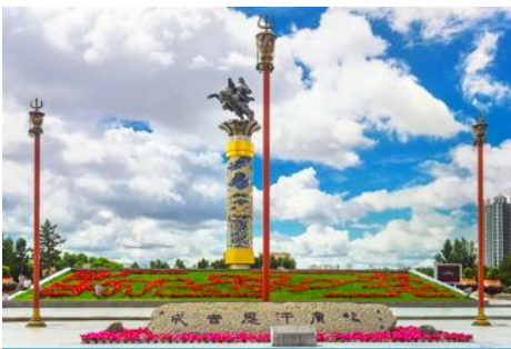
จัตุรัสวงกิสข่าน

หลังอาหารนำท่านเดินทางสู่เมือง ไห่ลาเอ๋อ 海拉尔市 (ระยะทาง 456 กม. ใช้เวลาเดินทางราว 5 ชั่วโมงครึ่ง)