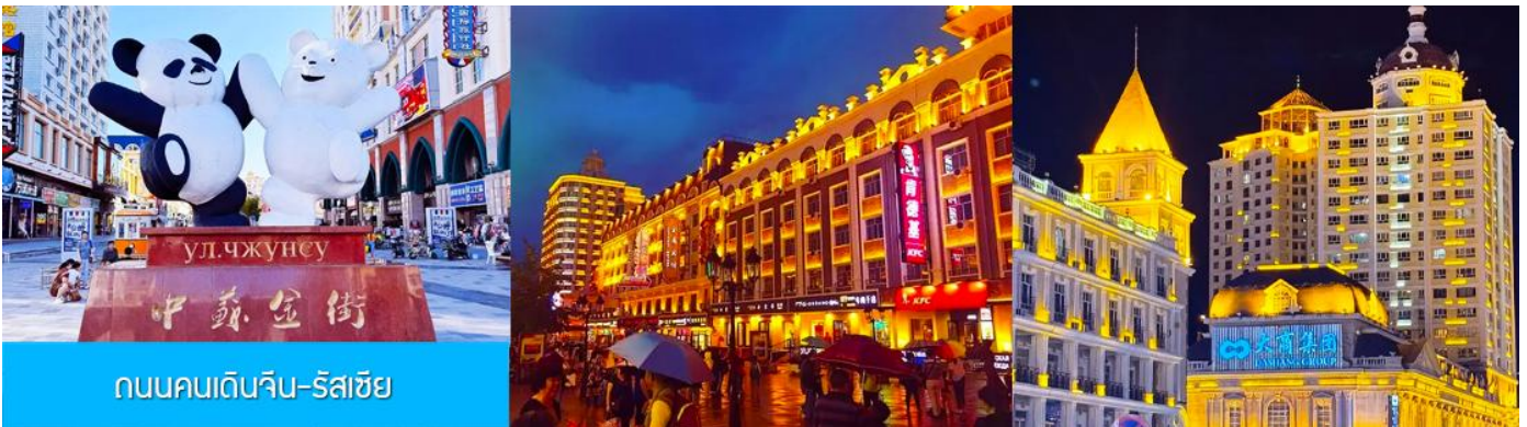
ถนนคนเดินจีน-รัสเซีย

ท่านสามารถเดินเที่ยวชม บริเวณจัตุรัสฯ เก็บภาพสวยงามของสถาปัตยกรรมสวยเก๋แบบรัสเซีย เที่ยวชมบริเวณล็อบบี้ของโรงแรมตุ๊กตารัสเซีย ที่มีการตกแต่งภายในอย่างวิจิตร งดงามทั้งลวดลายการตกแต่งและภาพสีน้ำมัน