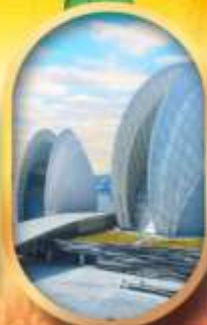
โรงละครไข่มุก