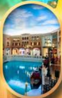
เดอะเวนิเซียน