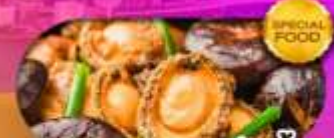
พิเศษเมนู หอยเป๋าฮื้อ เดินทาง มีนาคม 69