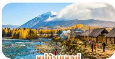
หมู่บ้านเหมอู๋