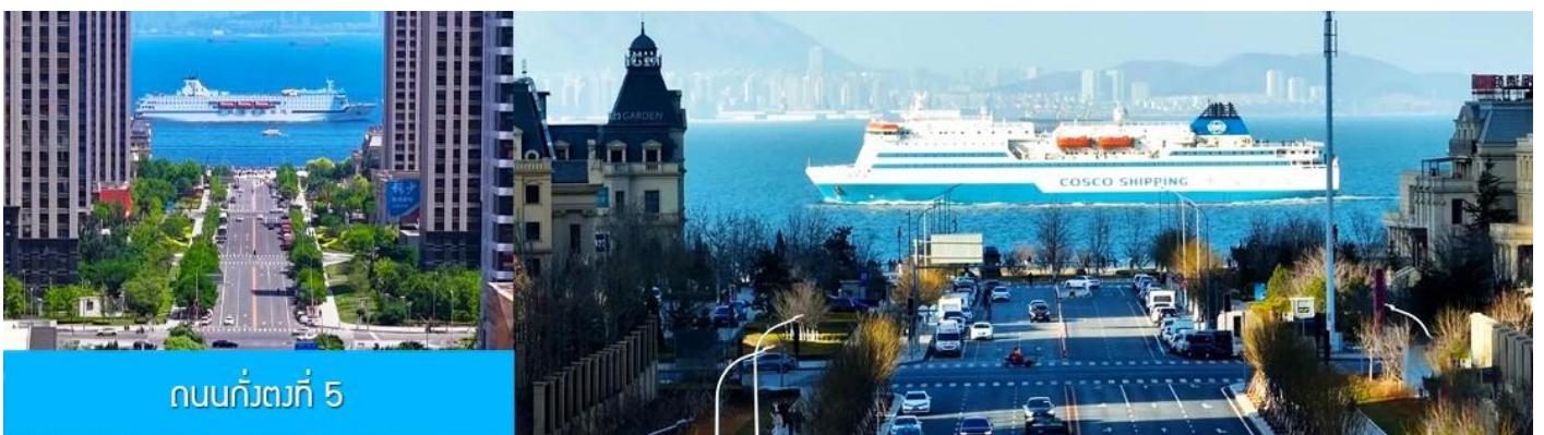
ถนนกว้างที่ 5

จากนั้นนำท่านเที่ยวชม สวนน้ำเมืองเวนิสตะวันออก 大连东方威尼斯城 เป็นเมืองเวนิสจำลองที่ถูกสร้างขึ้นด้วยทุนกว่า 8,000 ล้านดอลลาร์ ออกแบบโดยบริษัท ARC จากประเทศฝรั่งเศส โดยจำลองผังเมืองเวนิสในประเทศอิตาลี บนพื้นที่กว่า 400,000 ตารางเมตร ประกอบด้วยคลองเวนิสและอาคารที่มีสถาปัตยกรรมแบบตะวันตกกว่า 200 หลัง มีบริการล่องเรือคอนโดล่าแก่นักท่องเที่ยว นำท่านเดินชม ถ่ายภาพที่ระลึกท่ามกลาง