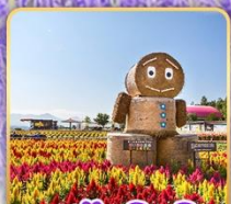
สวนซึกิโซโนะโอะกะ