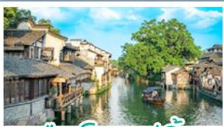
เมืองโบราณอู๋เจิน