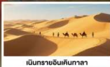
เนินทรายอินเคินกาลา