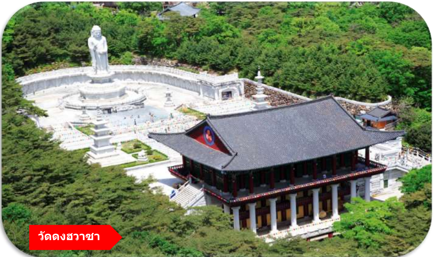
วัดดงฮวาซา

จากนั้น นำท่านเที่ยวชม วัดดงฮวาซา (Donghwas Temple) (รวมกระเช้า พัลกงซานเคเบิลคาร์) เป็นวัดพุทธนิกายโชกเยเก่าแก่กว่า 1,500 ปี ตั้งอยู่บนภูเขาพัลกงซานในเมืองแทกู โดดเด่นด้วยทัศนียภาพธรรมชาติที่สวยงาม ไฮไลท์สำคัญคือ "พระพุทธรูปหินขนาดใหญ่" หรือ พระพุทธรูปหินขนาดใหญ่ยักษ์สูงมากกว่า 30 เมตร สถาปัตยกรรมโบราณและกิจกรรมการพักผ่อนเชิงปฏิบัติธรรม สายมูห้ามพลาด ซึ่งคนเกาหลีนิยมไปสักการะเพื่อขอพรเรื่อง สุขภาพ อายุยืน แคล้วคลาดปลอดภัย ผ่านอุปสรรคต่าง ๆ