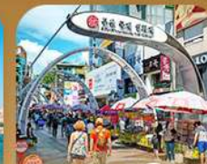
ตลาดนัมโพดง