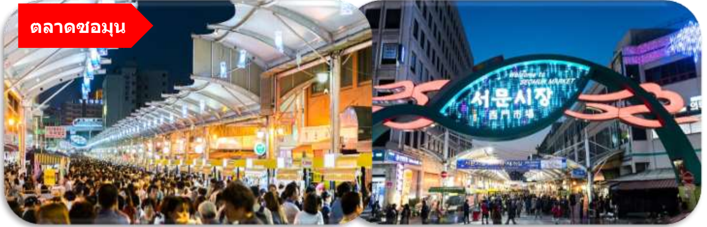
ตลาดชอมุน

นำท่านเที่ยวชม ตลาดชอมุน (Seomun Market) ตลาดพื้นเมืองชื่อดัง ที่มีประวัติยาวนานตั้งแต่สมัยโชซอน และถือเป็นหนึ่งในตลาดดั้งเดิมที่ใหญ่ที่สุดของเกาหลีใต้ ภายในเต็มไปด้วยของกินสตรีทฟู้ด ร้านผ้า เสื้อผ้า ของฝาก และบรรยากาศท้องถิ่นแบบเกาหลีแท้ ๆ ไฮไลท์ห้ามพลาดคือ "ตลาดกลางคืน" ที่คึกคักไปด้วยอาหารพื้นเมืองสุดอร่อย เช่น มันทูแป็งเกี้ยวแบน และดอกกบก็