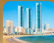
หาดแซอินแด