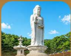
วัดดงซาซา

เปิดประสบการณ์เที่ยวเกาหลีสุดคุ้ม บินครั้งเดียว เที่ยวสองเมือง • เช็กอินถนนนักร้องคิมควังซอก สัมผัสเสน่ห์ศิลปะและเสียงเพลง • นั่งรถไฟปิ๊กซมว็อกทะเลปูซา • หมู่บ้านคิมซอนสีสดใสใ ก่อนเยือนวัดแฮดงยงกุงซาและวัดคยองฮวาซา เสริมความเป็นสิริมงคล • เวชชะทำเรือสิริ่ง Bunezia ปิดท้ายด้วยชายหาดแฮอนแดแลนด์มาร์กชื่อดัง พร้อมเดินช้อปปิ้ง Walking Street สุดฟิว