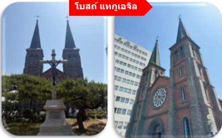
โบสถ์ แทกูเจิล

นำท่านเที่ยวชม โบสถ์แทกูเจิล โบสถ์นิกายโปรเตสแตนต์ที่เก่าแก่ที่สุดใน จังหวัดคยอกซังบุก (Gyeongsangbuk-do) ตั้งอยู่ในบริเวณ Cheongna ซึ่งเป็นย่านที่อยู่อาศัยของเหล่ามิชชันนารีที่มาอาศัยอยู่ใน เมืองแทกู