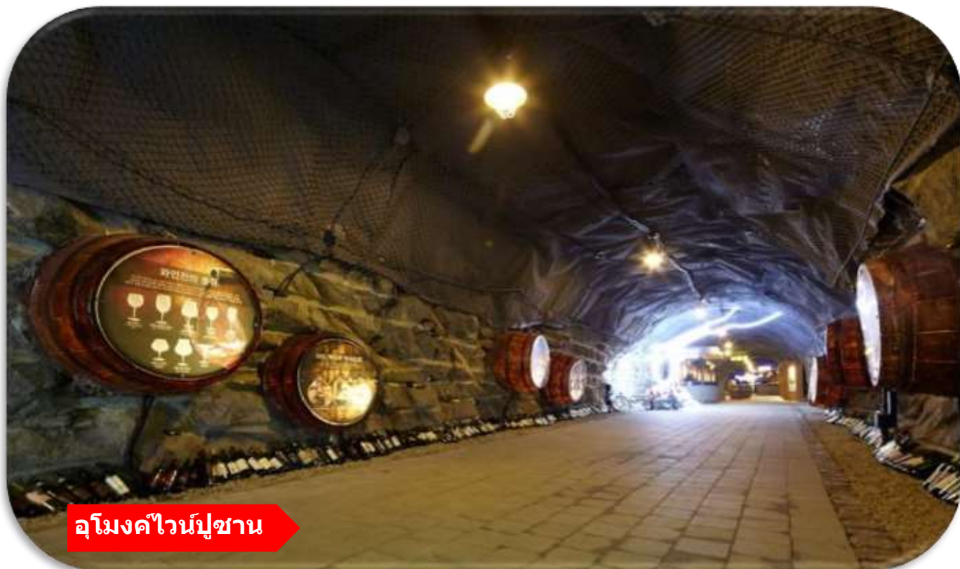
อุโมงค์ไวน์ปูซาน

เยี่ยมชม อุโมงค์ไวน์ปูซาน (Busan Wine Cave) เป็นอุโมงค์ไวน์สดซิคที่ตกแต่งด้วยแสงสีและงานศิลปะภายในถ้ำ บรรยากาศเย็นสบาย โรแมนติก และเหมาะกับการถ่ายรูปภายในมีโซนชิมไวน์ ผลิตภัณฑ์ท้องถิ่น และมุมจัดแสดงที่ผสมผสานความทันสมัยกับเสน่ห์ของอุโมงค์ใต้ดินได้อย่างลงตัว