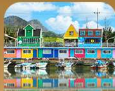
ท่าเรือจั้งนึม