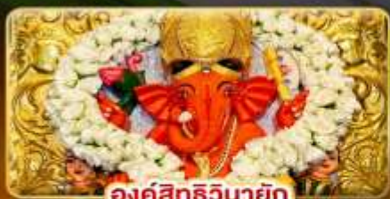
องค์สิทธินายก