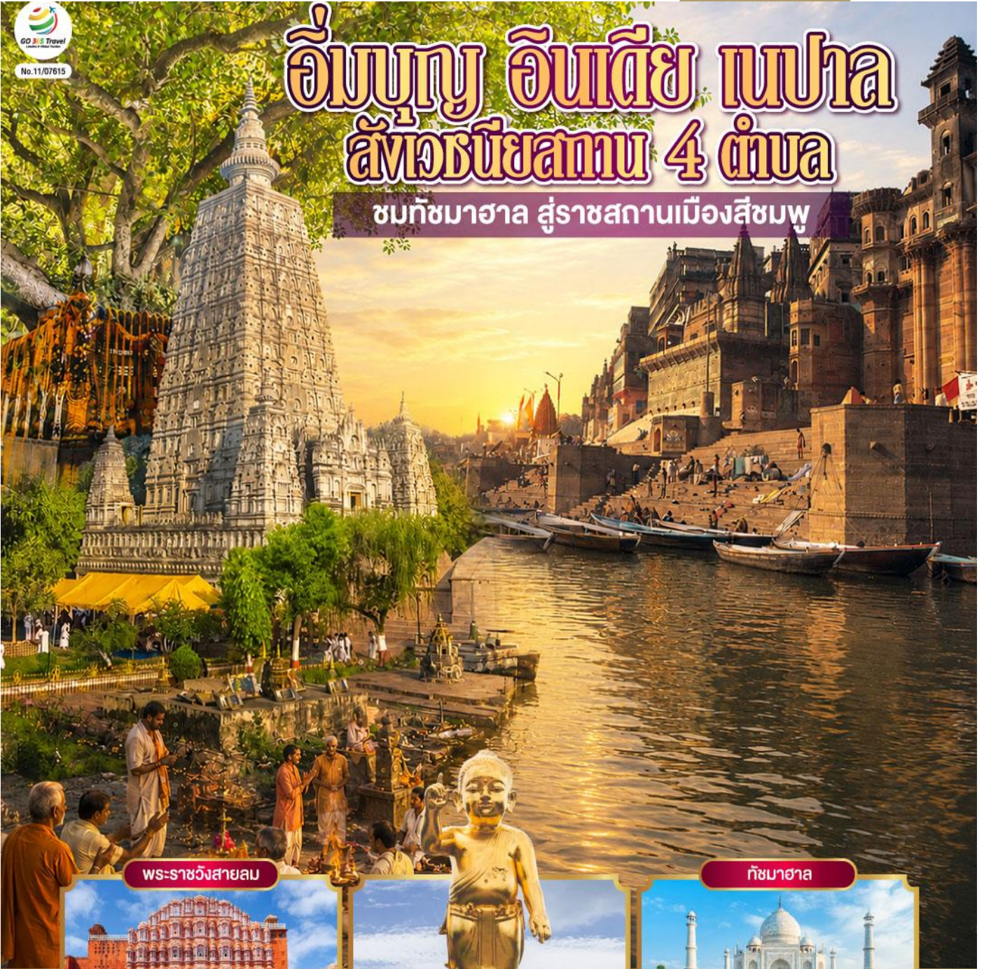
พระราชวังสายลม