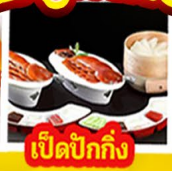
เปิดปิกกิ้ง