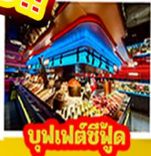
บูฟเฟต์ซีฟู้ด