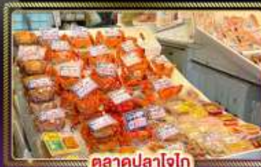
ตลาดปลาโอไก