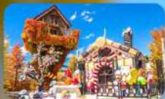
โรงงานช็อกโกแลต ชิโรอิ โคอิบิโตะ