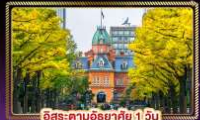
ฮิโระ-ตามฮิโระ 1 วัน

น้ำหนักกระเป๋า 20 Kg. บริการอาหาร บนเครื่องบิน