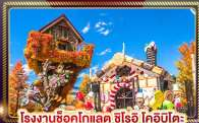
โรงงานช็อคโกแลต ชิโรอิ โคอิบิโคะ