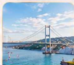
BOSPHORUS STRAIT ช่องแคบบอสฟอรัส