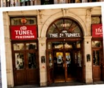
สถานีทูเนล (TUNEL STATION) สถานีรถไฟใต้ดินสายเก่าแก่และเป็นหนึ่งในระบบขนส่งที่เก่าแก่ที่สุดในโลก