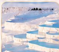
PAMUKKALE ปามุกคาล่า