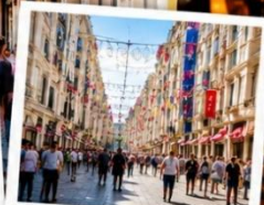
ISTIKLAL STREET (Grand Avenue of Pera) ถนนสายช้อปปิ้ง ยิม ฮีล ครองขงในเทียว