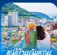
หมู่บ้านดัมเชอน