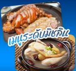
เมนูระดับมิชลิน

เที่ยวครบ 3 เมืองฮิต โซล - แทกู - ปูซาน สัมผัสเสน่ห์เกาหลีหลากหลายสไตล์ • ชมพระราชมังคลาภิเษก ตึก Lotte World Tower พร้อมจุดชมวิว Seoul Sky ในกรุงโซล • ชิคอินทนน Art Street ตามรอย BTS ตลาดชอมนุน • แลนด์มาร์ก 83 Tower ที่แทกู • ปักถ่ายที่ปูซานกับวัดแสงดงยงกุงซา หมู่บ้านวัฒนธรรมคิมชอน โซลคิทนั่งรถไฟสายกายภาพเปลี่ยนขบวนวิ่งทะเลสุดประทับใจ • เดินทางสะดวกด้วยรถไฟความเร็วสูง KTX อิมมอร์ทัลกับเมนูพิเศษ จากหมู่เกาะฮัลลันและไคคุบไซมระดับมิชลิน เก็บครบทุกความประทับใจในทริปเดียว