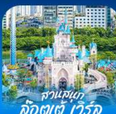
สวนสนุก ค็องตัท ทีวีค