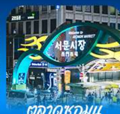
ตลาดชอมนุน