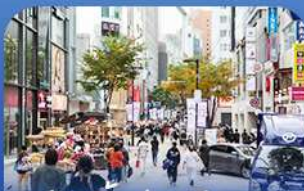
ซ้อปบิงข่านเมียงดง