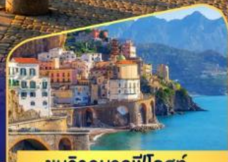
ชมวิวมอลฟีโคสก์