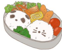
● อาหารสำหรับเด็ก ( 2-11 ปี ) *วัตถุประสงค์ขึ้นอยู่กับทาว์ราน