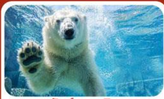
สวนสัตว์อาซาฮิยามะ