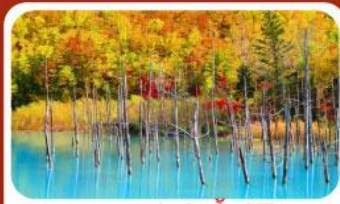
บลูพอนด์ (บ่อน้ำสีฟ้า)