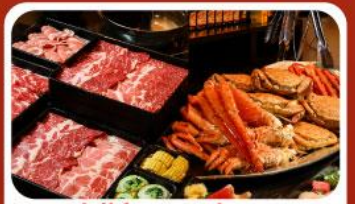
บุฟเฟ่ต์ซาบู ซาปู 3 ชนิด