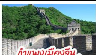
กำแพงเมืองจีน ด่านมู่เทียนยวี่

Universal Beijing - กำแพงเมืองจีนด่านมู่เทียนยวี่ (รวมกระเช้าขึ้น-ลง) พระราชวังโบราณกู้กง - หอฟ้าเทียนถาน - ซุปป์ิงถนนหวงฝูจิ่ง และซานหลี่กุน เมนูพิเศษ สุกิมองโก, เป็ดปักกิ่ง, Michelin Guide ร้าน Tao Tao Ju