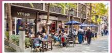
ชิ่นเทียนตี้