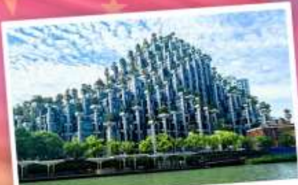
ต้นไม้พันต้น