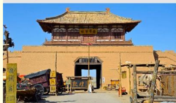
เมืองโบราณตุนหวง