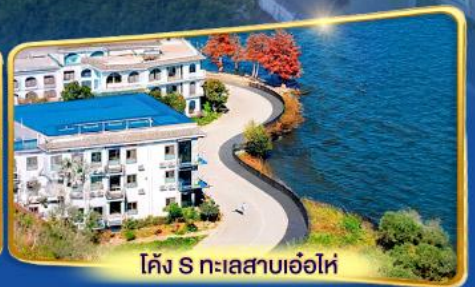
โค้ง S ทะเลสาบเอ่อไห่