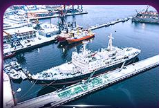
เรือตัดน้ำแข็งเลนิน