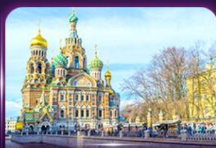
โบสถ์แห่งหยดเลือด