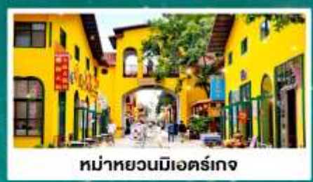
หมู่บ้านมื่อเออร์เกง