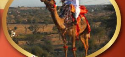
ฟรี ژیออู เมืองมันทอวา ราคาเริ่มต้น