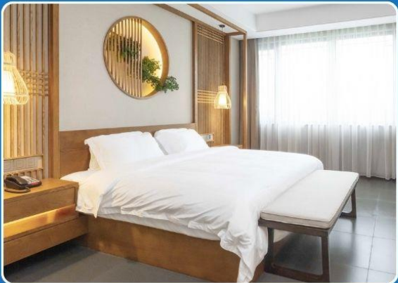
👤👤 DOUBLE (DBL)