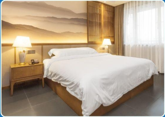
👤 SINGLE (SGL)