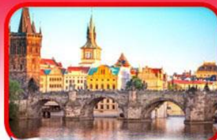
เขื่อนอินสพานชาร์ลส์