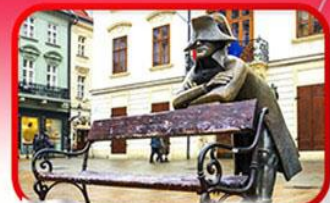
ย่านเมืองเก่าบราติสลาวา

เที่ยวเมืองสวยริมทะเลสาบ ฮัลล์สตัดท์ • ชมเมืองไข่มุกแห่งโบฮีเมีย เซสกี กรุงลอน • ปราก • เวียนนา • ซอปปิงพาร์นดอร์ฟ เอาก์เลิน