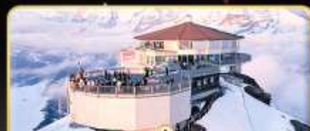
ทานอาหารที่ Piz Gloria ภัตตาคารที่หมุนได้ 360 องศา