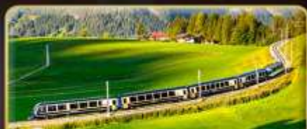
นั่งรถไฟสายโรแมนติก 2 สาย Golden Pass / Luzern Interlaken Express

📅 เดินทาง: 5-12 เม.ย. | 31 พ.ค.-7 มิ.ย. 69