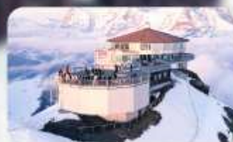
ทานอาหารที่ Piz Gloria ภัตตาคารที่หมุนได้ 360 องศา