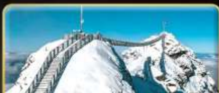
พิชิต 3 ยอดเขาตั้ง Rigi / Schilthorn / Glacier 3000